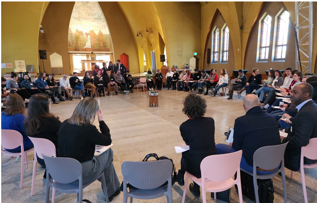
Les Conversations montréalaises – Est de Montréal – se sont déroulées vendredi dernier dans l'ancienne église Saint-Enfant-Jésus, à Pointe-aux-Trembles (EMM)