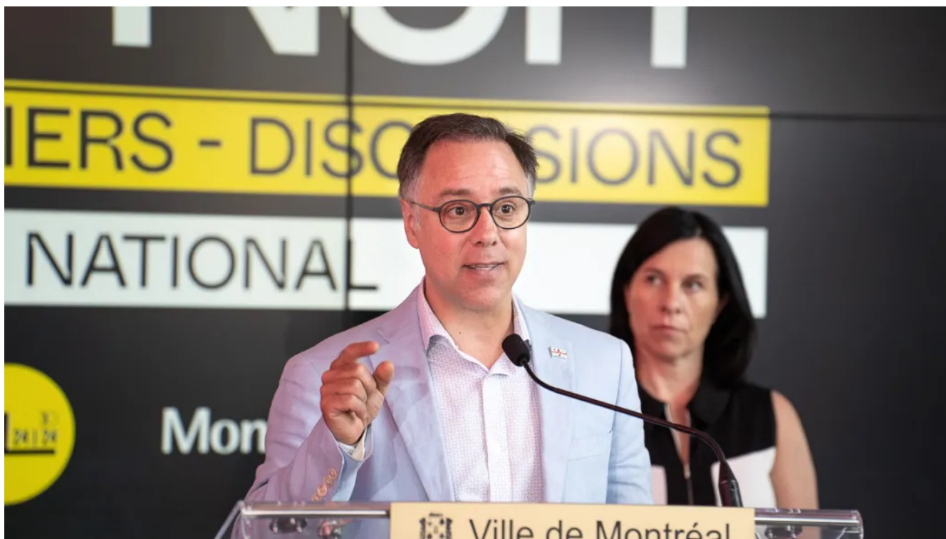
Le maire du Plateau-Mont-Royal, Luc Rabouin.